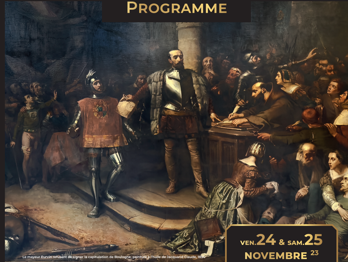
Le mayor Eurvin refusant de signer la capitulation de Boulogne, peinture à l'huile de Jacquand Claude, 1857